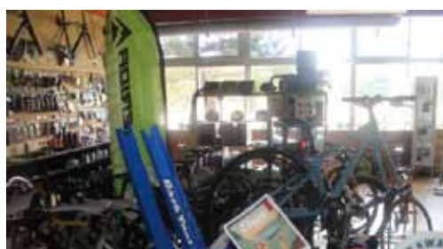
▲Cycle GATE Tamagawa

例えば、立川青年会議所の地元の魅力を発掘するショートムービー作成や 9 月に、立川市子ども未来センター芝生広場で行われる野外劇の公演に協力しています。まさに「まちづくりとは、街を演出すること」をテーマに次々と新しい企画を打ち出しています。