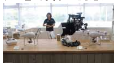
ドローンショールームで体験フライトもできます▲ ※詳細 http://sekidocorp.com/sekido-dji-experience-store/