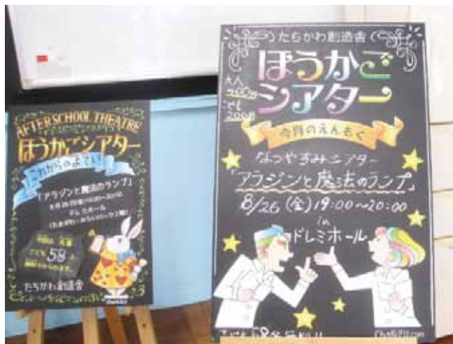
▲シェア・オフィス・メンバーのチョークアーティストの作品

しばい」が楽しめる「放課後シアター」を開催。特徴的なしかけとして、大人のみ購入可能な回数券「あしながチケット」は、自分で使うことも、回数券を寄付することで、子どもたちに観劇をプレゼントすることもできるという、地域に向けた事業を展開しています。