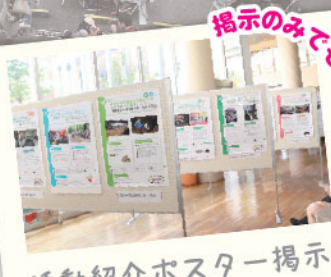
活動紹介ポスター掲示