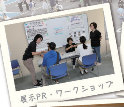
展示PR・ワークショップ