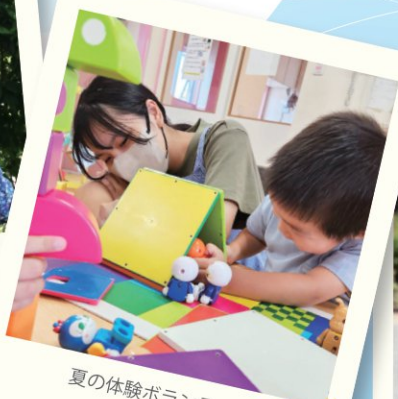
夏の体験ボランティア