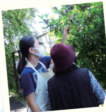
夏の体験ボランティア