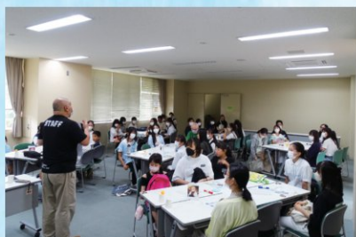
▲ オリエンテーションの様子 グループワークで交流を深めたあと、 ボランティアの心得などを説明。