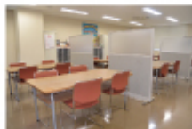
●作業室（定員24人） グループに分かれ簡単な作業などができます。