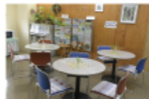
●フリースペース（定員8人） 予約不要でどなたでも利用できます。

※新型コロナウイルス感染症に伴い、定員や利用時刻の変更がある場合がございます。詳しくは、HPまたはお問い合わせください。