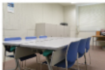
●点字録音室（定員8人） 録音設備が付いた防音室、通常の食会にも利用可。