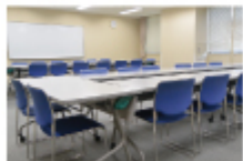
●会議室（定員32人） 会議、セミナー等に活用できます。